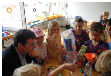
Spannende Experimente im „Haus der kleinen Forscher“

Stuttgart – Kurz vor den Sommerferien habe ich auf Einladung der bundesweiten Initiative „Haus der kleinen Forscher“ den katholischen Kindergarten Mariä Him-