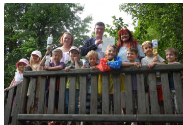
Zusammen mit den Kindern und den Betreuerinnen

Forscherdiplom, welches mir die Kinder überreicht haben. Weitere Infos im Internet: http://www.haus-der-kleinen-forscher.de/